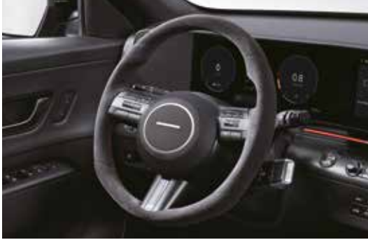
알칸타라 스티어링 휠