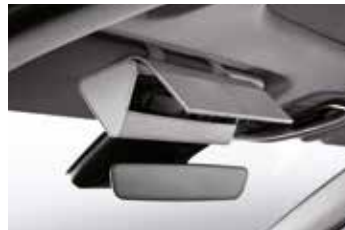
선바이저 선글라스 케이스

※ C to USB-A 변환 젠더는 현대자동차 전용 개발 제품으로 타 제품 및 타 자동차 브랜드에서는 작동을 보장하지 않습니다.