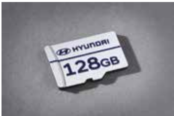
블트인 캠 2 전용 마이크로SD 카드(128GB)