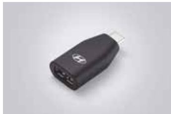
C to USB-A 변환 젠더